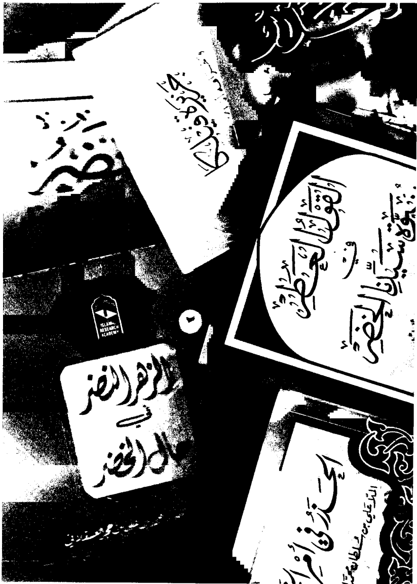
نماذج من المراجع القديمة والحديثة في شأن الخضر الكليل